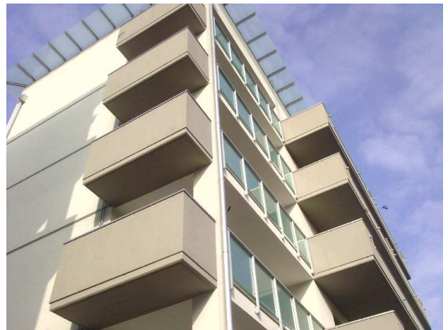
COMO VIA P.PAOLI – NUOVI EDIFICI RESIDENZIALI