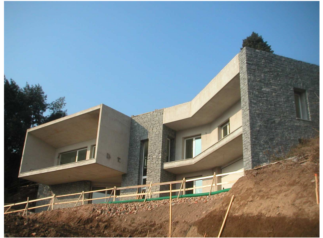
LAGO DI COMO - VILLE PRIVATE