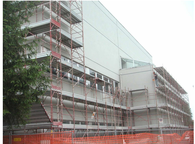
ISTITUTO MAGISTRI CUMACINI A COMO - INTERVENTI TECNOLOGICI DI RISANAMENTO