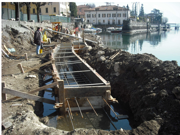
CASSERI FONDAZIONI IN ACQUA