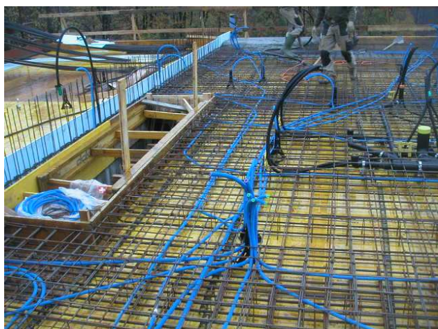
OPERE IN C.A. CON IMPIANTISTICA PRIMA DEI GETTI