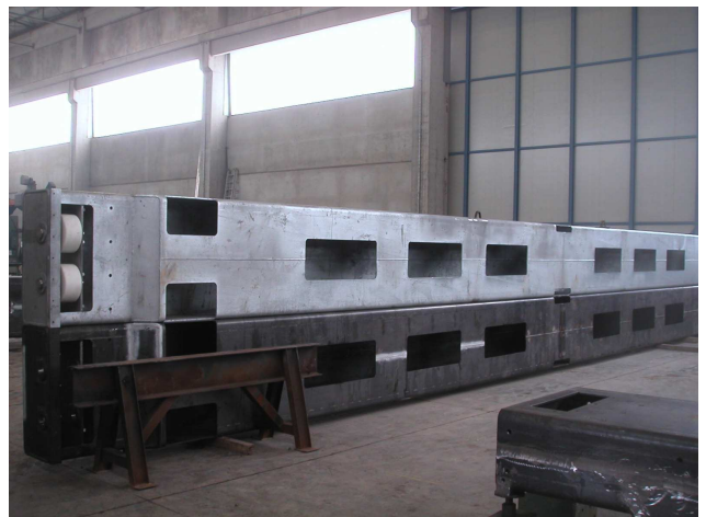
LAVORI DI CARPENTERIA METALLICA