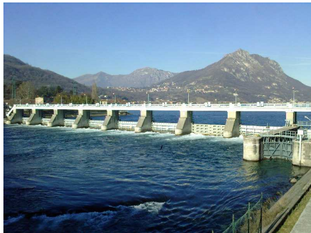
DIGA DI OLGINATE (LAGO DI LECCO) - SOSTITUZIONE DELLE PARATOIE