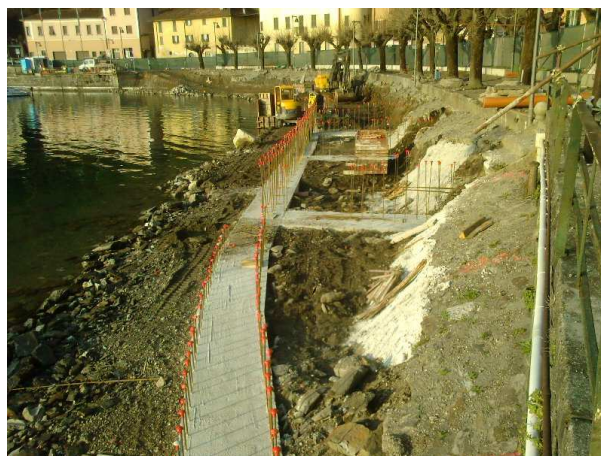
BASAMENTO PER NUOVI MURI