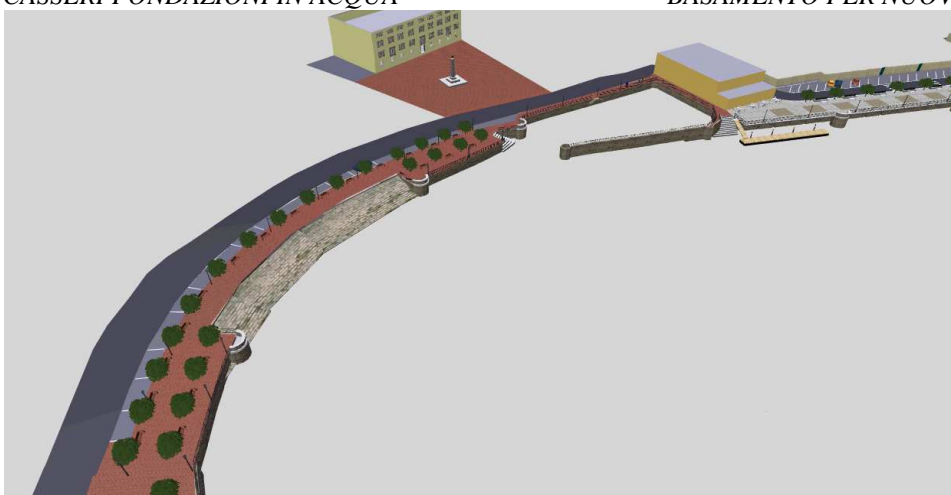
SIMULAZIONE FOTO-RENDERING AMPLIAMENTO FRONTE LACUALE (DONGO-COMO)