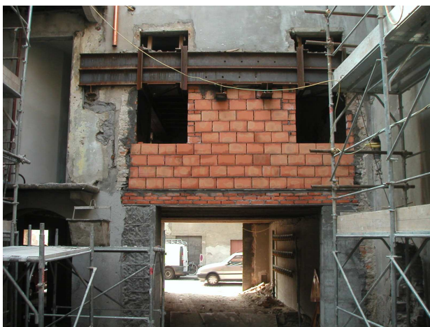
OPERE DI CONSOLIDAMENTO E RISTRUTTURAZIONE