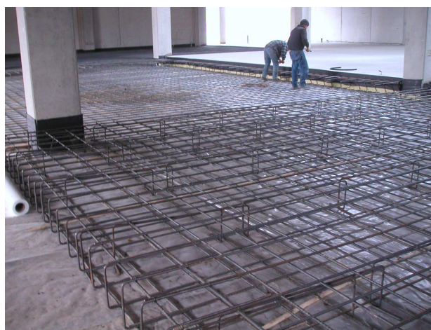
SPECIALI RINFORZI PER MACCHINARI