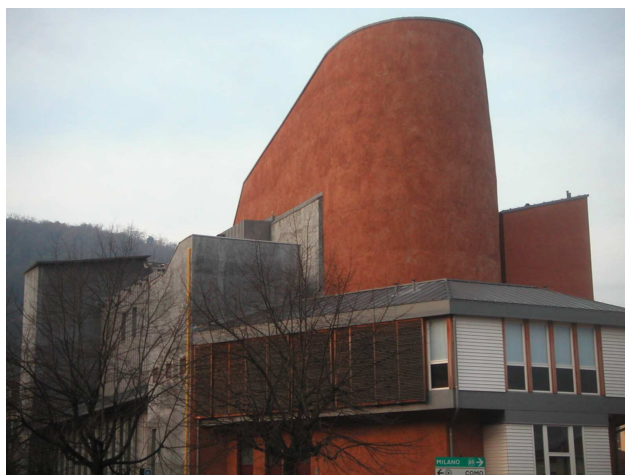
COMO – CHIESA DI PONTECHIASSO