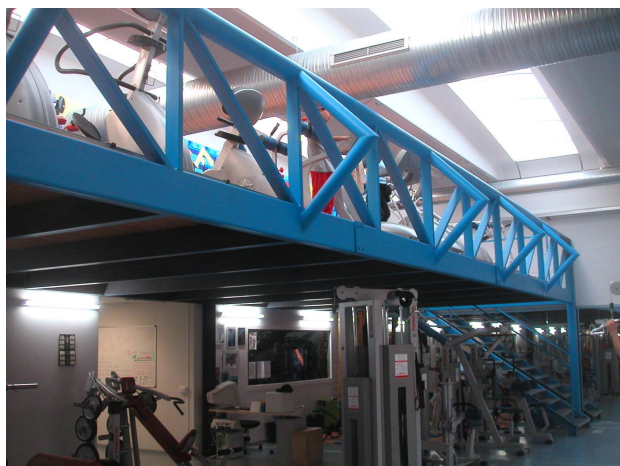
PROGETTAZIONE CARPENTERIA METALLICA