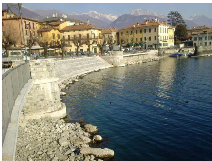
LUNGOLAGO IN FASE DI ULTIMAZIONE (DONGO-COMO)