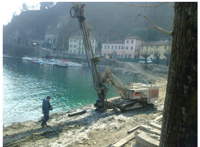
PALIFCAZIONE PER ALLARGAMENTO FRONTE-ACQUA