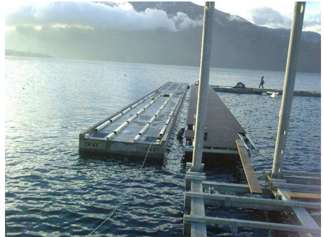
OPERE PORTUALI – PORTO DI MANDELLO LEGA NAVALE